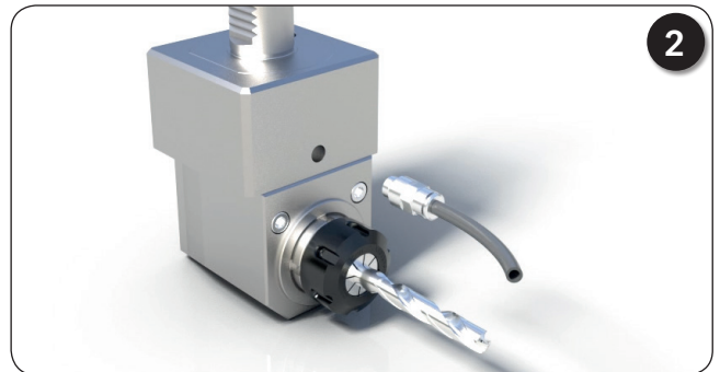
Demontage Kühlmittelrohr, ER-Mutter und Werkzeug