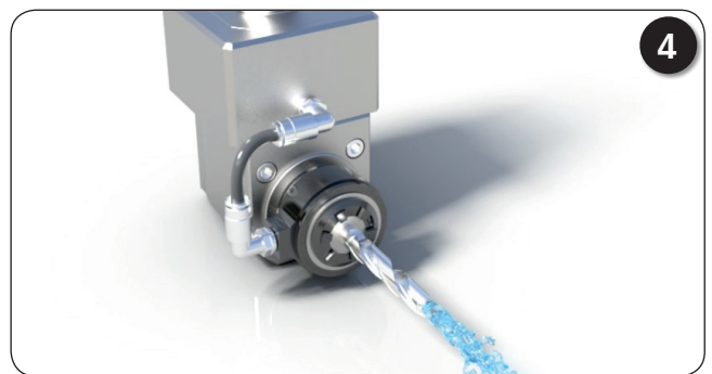
Loslegen mit Innenkühlung!